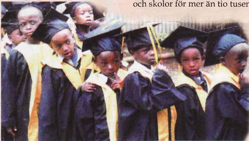
Examen i lågstadiet. Eleverna får diplom, iklädda dräkter inspirerade av amerikanska universitetsskrudar.

Han landade i Nairobi med två tomma händer men med föresatsen att göra en insats. Nu, efter 40 år, har han initierat och startat en enastående verksamhet: 84 kyrkor har byggts och skolor för mer än tio tusen elever startats över hela