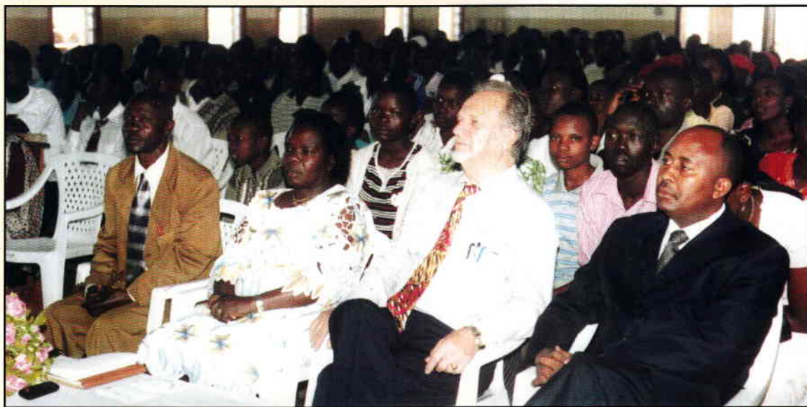
Förmiddagsgudstjänst i Faith Homes kyrka i Makutano.

Söndag var sista dagen i högtiden med gudstjänstbesök som höjdpunkt. Roligt att se en välfylld kyrka med vackra söndagsklädda människor. Flera körer sjöng så vackert till Guds ära. Sedvanligt så inbjuds gästerna att medverka och till sist avslutades samlingen med en predikan av pastorn. Gudstjänstbesökarna är verkligen glada och tacksamma för livet.