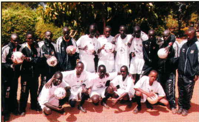
Spelare och reserver stiligt skrudade i helvita uniformer samt avundsvärt fina bollar.

Fredagen var det uppträdande i kyrkan med alla skolklasser, allt från förskola med barn på tre/fyra år till sista klass i grundskolan. Även lärarna hade ett eget program. Dessa elever är fantastiskt duktiga på att sjunga, dansa och rappa m.m. Elever från Sudan som går på skolan hade också ett särskilt program.