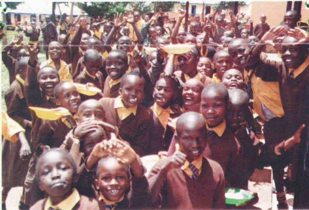
Glada och tacksamma elever som får undervisning och mat vid en av våra skolor.