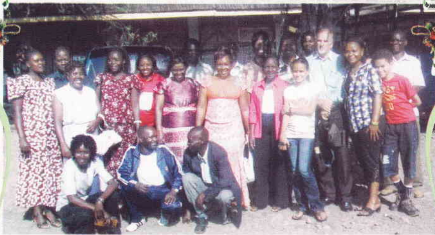
Deltagare i Faith Homes intensivkurs i Effektivt Ledarskap.

Som gästtalare hade jag inbjudit en duktig och välkänd föreläsare inom bekantskapskretsen med betoning på effektivt ledarskap, kommunikation och information, bedömning och utvärdering m.m.