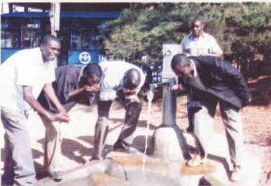
En nybyggd brunn med friskt vatten i Makutano. Två är under uppbyggnad.

Vatten ger liv och vatten är också grunden för allt liv. Men idag saknar massor av människor tillgång till rent och drickbart vatten. Det vill Faith Homes ändra på. Genom att gräva djupa brunnar (70 - 90 fot), installera pumpar och montera vattentankar (5000 - 10000 liter) erbjuder vi flera människor, främst våra skol- och barnhemsbarn, att få tillgång till vatten.