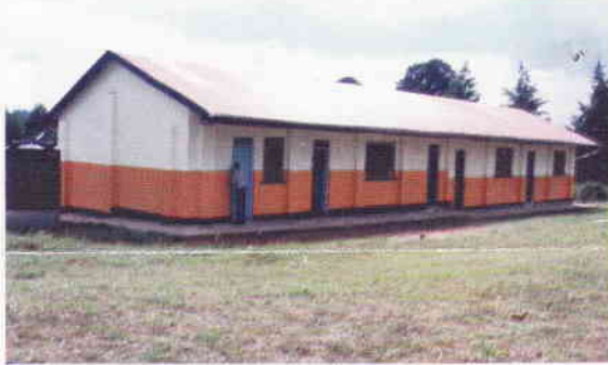
Vår nybyggda förskola i Kiminini.

Rubriken här ovan är namnet på och inledningen till Faith Homes identitets- och hyllningssång, något av en signaturmelodi. Sången har sjungits upprepade gånger på sistone av Faith Homes masskör vid examensdagar, kyrkinvigningar, föräldradagar, årsavslutningar och andra olika högtidligheter. Den inspirerar, lyfter, engagerar och entusiasmerar. Självt blir jag smått rörd av såväl rytm som innehåll. Och visst tågar Faith Homes fram, tack vare våra omutligt goda givare.