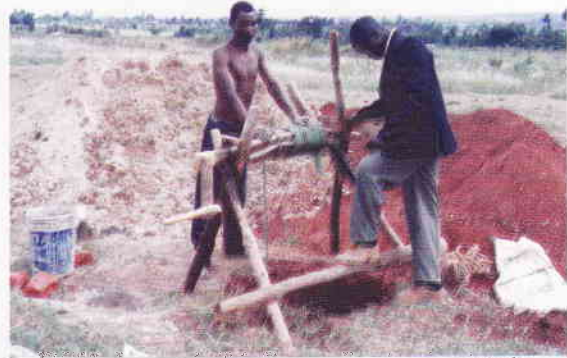
En brunn under uppbyggnad i Kiminini. En annan brunn är redan färdig här.