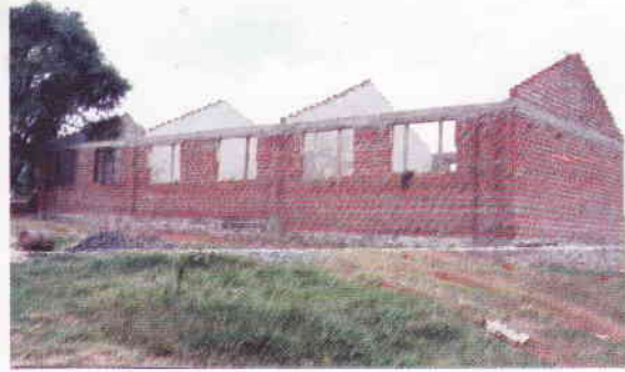
Grundskolan under uppbyggnad i Kiminini.

Vatten ger liv och vatten är också grunden för allt liv. Men idag saknar massor av människor tillgång till rent och drickbart vatten. Det vill Faith Homes ändra på. Genom att gräva djupa brunnar (70 - 90 fot), installera pumpar och montera vattentankar (5000 - 10000 liter) erbjuder vi flera människor, främst våra skol- och barnhemsbarn, att få tillgång till vatten.