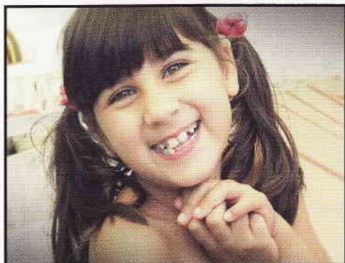
Ett av alla de föräldralösa barn som under åren fått en familj

Denna resumé av EFI Fadder/FCE:s 20åriga historia, där varje mening rymmer sin egen historia, vill vara en uppmaning och ett tack till alla som på ett utgivande och generöst sätt arbetar för våra barns och ungdomars bästa! All ära till Gud, som gav livet och som genom sin stora kärlek visar omsorg om varje liten människa!