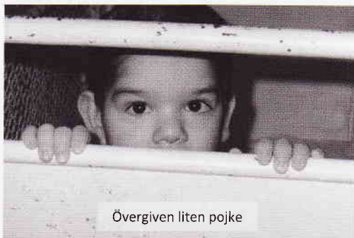
Övergiven liten pojke

Med hjälp av människor på plats ville man ge dessa barn ett hopp om ett bättre liv! 1991 blev det en resa till och en till och en till... Fler människor kom till och tillsammans med kristna i Marghita började ett hjälparbete växa fram. Det berörde främst barnhemmet i Popești, avdelningen för övergivna småbarn