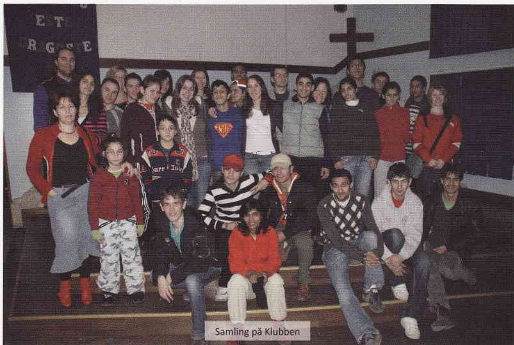
Samling på Klubben

Den stora ekonomiska krisen 2007 hotade igenslagning av projekt och den stora frågan var vilka av dessa beroende barn och ungdomar som skulle tvingas bli utan hjälp. Även under den perioden visade Gud sin oerört stora kärlek till dessa minsta. Engagerade människor från olika delar av världen forsatte troget sitt stöd och hittade nya vägar för att fortsätta det arbete, som påbörjats och som är till hjälp för så många. FCE:s anställda tar ett ännu större ansvar och samtidigt sätter alla berörda en större tillit till Guds omsorg.