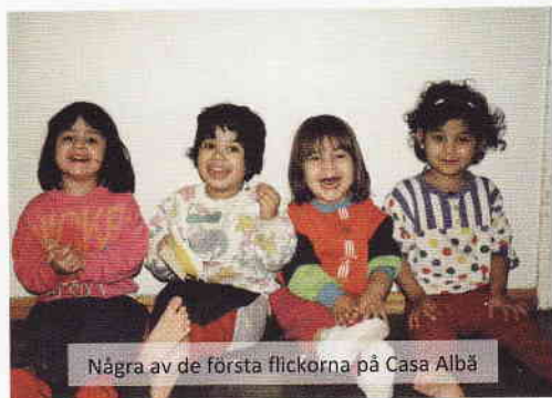
Några av de första flickorna på Casa Albă

Den första transitgenerationen flyttade ut för att stå "på egna ben". En del fick hjälp med egna bostäder, men facit säger att det efter den uppväxt de haft, var för svårt för en del